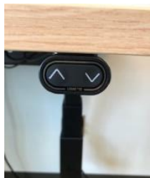
Figure 1 : Ajustement de la hauteur