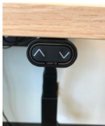
Figure 1 : Ajustement de la hauteur